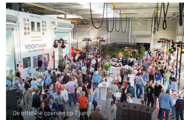
De officiële opening op 7 juni